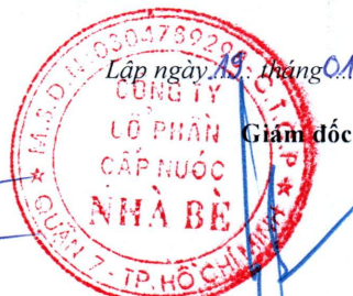
Lý Thành Tài