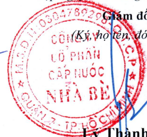
Lý Thành Tài